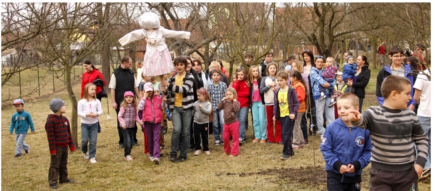
Nivnička vynášá Mařenu (Moranu, smrtku). foto z archívu Nivničky jsou z let 2012, 2013 a 2017.