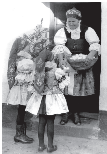
Velikonoční pohlednice vydaná Vlastivědným kroužkem Nivnice.