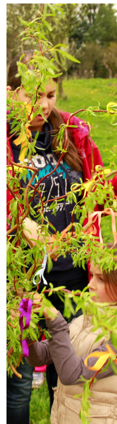
Příprava LETEČKA. foto: Nivnička 2014.