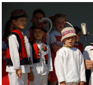
fota: VÁŘENÍ TRNEK, Dolní Němčič 31. 8. 2013