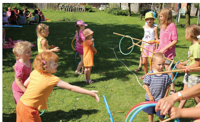
Na Modřínové lúce v Boršicích u Blatnice 10. července 2011.