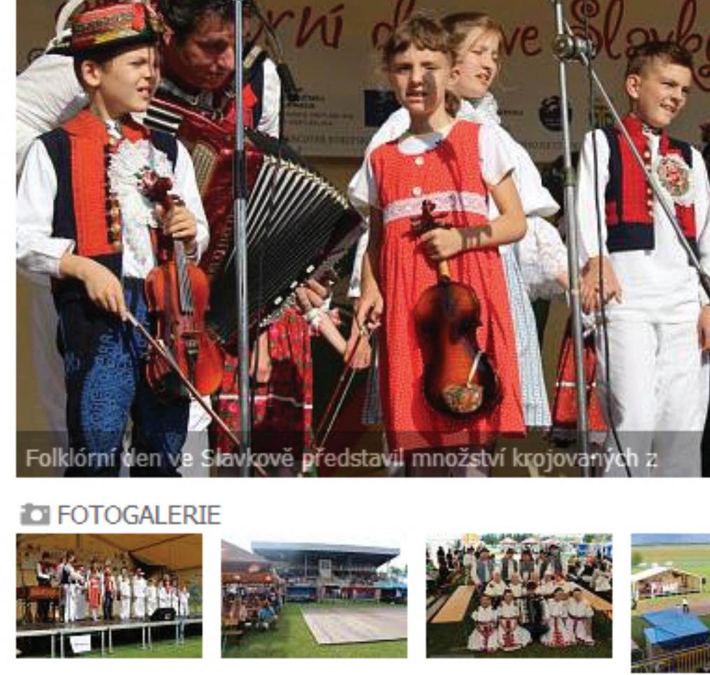
Folklorní tan v Slavkově. Představí množství krojovin z...

Slavkov – Kroky mnohých obyvatel Slavkova v sobotu 16. srpna směřovaly do areálu tamějšího fotbalového hřiště. Ten totiž o tomto víkendu ožil tóny hudby, kterou do jeho prostor přinesl již čtvrtý ročník Folklorního dne ve Slavkově.